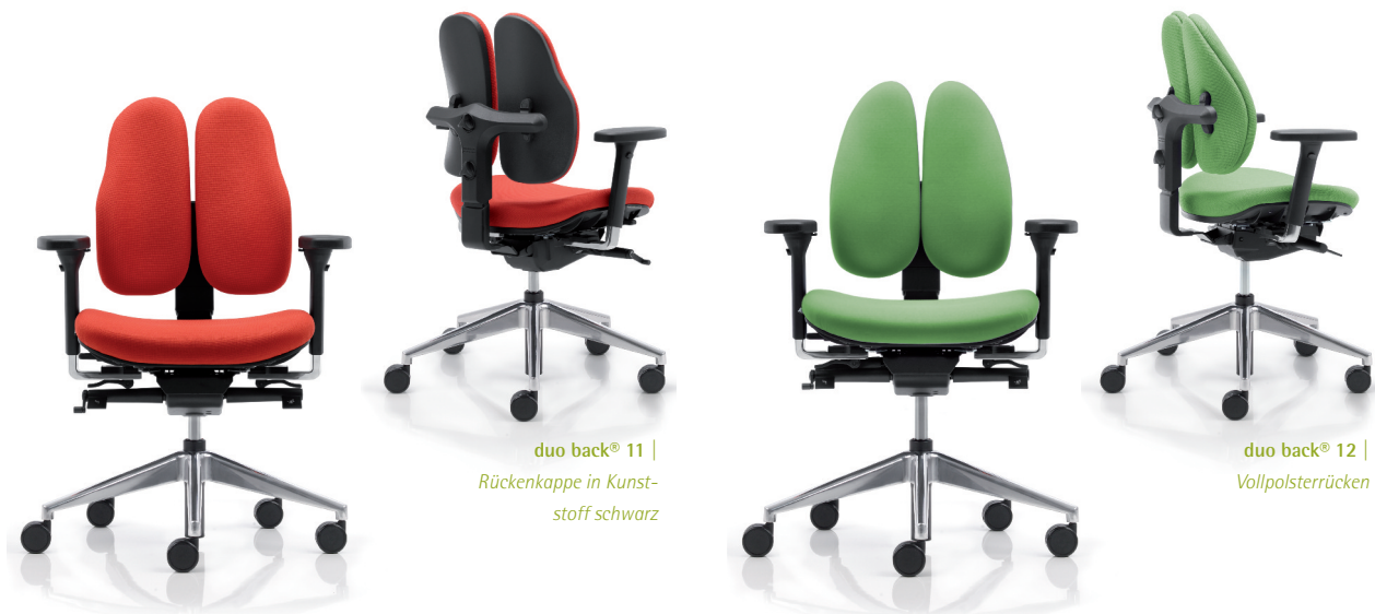
duo back® 11 | Rückenkappe in Kunst- stoff schwarz

Aus diesem Grund wird der duo back® von Rückenschulen, Orthopäden und Krankenkassen empfohlen. Der duo back® stärkt den Rücken und ist in jeder Hinsicht eine gute Investition: Rückenbeschwerden werden verringert.