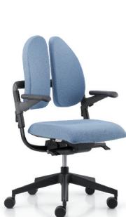
xenium-basic duo back®

Nach jedem Geschmack Wir haben das duo back® Prinzip auch in anderen Stuhlfamilien zum Einsatz gebracht.